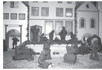
Krippe in St. Andreas