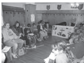
Gottesdienst während der Kinderfreizeit in Monschau

13. bis 15. Juni für Kinder im Alter von 7-12 Jahren