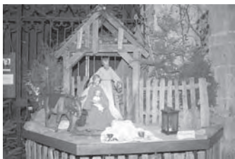
Krippe in St. Kolumba

27 Krippengänger scharten sich um die heilige Familie in St. Kolumba, bekannt als „Madonna in den Trümmern“ und seit 2008 umbaut mit dem Diözesanmuseum. Wissenswertes zu Kirche und Krippe erläuterte