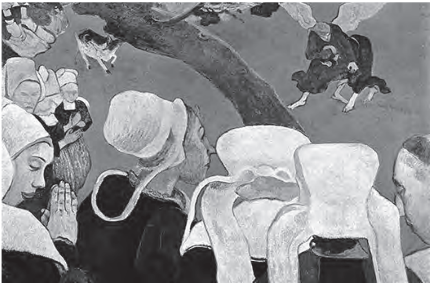
Paul Gauguin, Vision nach der Predigt (Jakobs Kampf mit dem Engel), 1888

Jakob wird auf seinem Weg noch andere entscheidende Dinge nicht sofort erkennen. Nachdem er bei seinem Onkel Laban sieben Jahre gearbeitet hat, um die von ihm verehrte Tochter Rahel zur Frau nehmen zu dürfen, jubelt ihm der Onkel die ältere Tochter Lea unter, wessen er aber in der Hochzeitsnacht nicht gewahr wird. Erst nachdem er weitere sieben Jahre dient, bekommt er auch seine Rahel. Wenn man auf die gesamte Jakobs-geschichte schaut, dann könnte dieser Betrug des On-