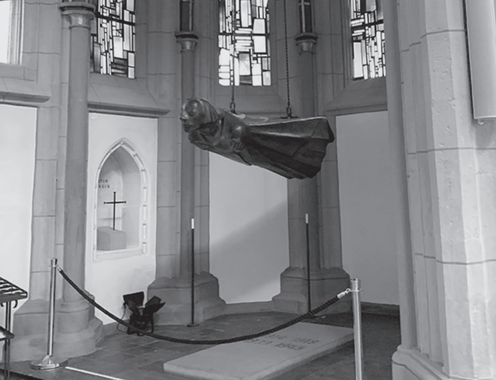
Ernst Barlach - Der schwebende Engel, 1927/1939

Seit 2016 hängt ein Nagelkreuz von Coventry in der nördlichen Seitenkapelle. Es handelt sich um eine Nachbildung des Kreuzes, das der Bischof aus Zimmermannsnägeln der zerstörten Kathedrale gefertigt hatte, nachdem die mittelenglische Stadt 1940 bei einem schweren Luftangriff durch die Deutschen Luftwaffe verwüstet worden war und hunderte Tote zu beklagen hatte. Das Nagelkreuz gilt als Symbol für weltweite Versöhnung.