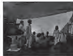
Herbstsingwoche 2023.