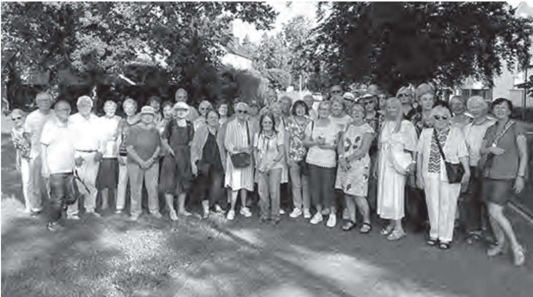
Der Kontaktclub in Xanten – Stadterkundung auf eigene Faust

an der Stadtmauer Xantens zu uns in den Bus steigen wollte. Unsere individuellen Fähigkeiten einer Stadterkundung waren daher gefragt ... Zum Glück liegen die Sehenswürdigkeiten Xantens nah beieinander, sodass wir in kurzer Zeit zumindest die Stiftskirche St. Viktor (genannt der Dom) besichtigen konnten – eine sehr schöne Kirche mit prächtigem Altar, der ein wenig an St. Ursula in Köln erinnert.