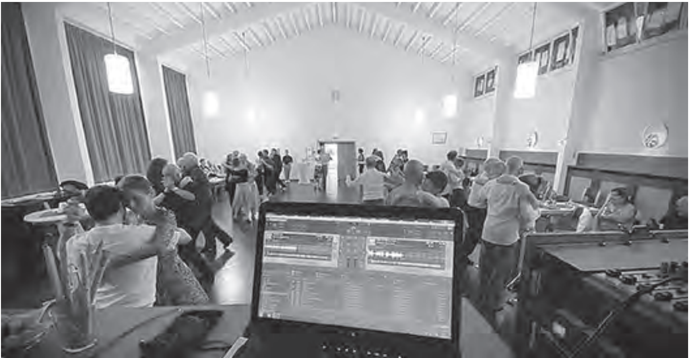
Tanzabend im Großen Saal