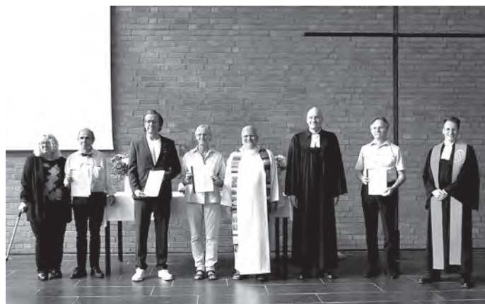
Nach der Unterzeichnung der Partnerschaftsvereinbarung

Am 29. Juni 2024 wurde im Rahmen eines Ökumenischen Gottesdienstes in der Philippuskirche die neue Ökumenische Partnerschaftsvereinbarung zwischen den Evangelischen Kirchengemeinden Köln-Bayenthal, Köln-Raderthal und Köln-Zollstock und den Katholischen Pfarrgemeinden Köln am Südkreuz unterzeichnet. Darin verpflichten sich die Gemeinden, durch gemeinsame Gottesdienste, Veranstaltungen, Feste sowie regelmäßige Treffen der Leitungsgremien das ökume-